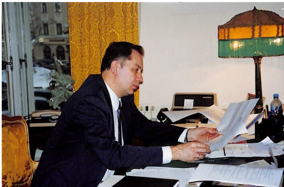
Фото 9. Ректор в своем кабинете за работой. Февраль 2002 г.