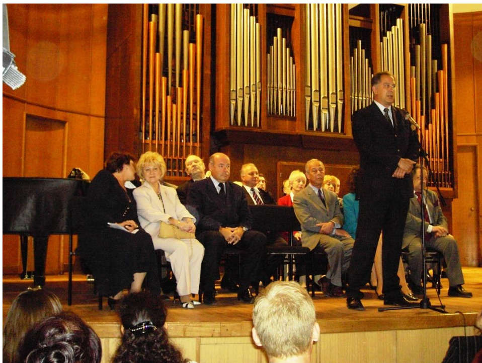
Фото 15. Министр культуры выступает на Дне знаний в Малом зале консерватории. 1 сентября 2005 г.