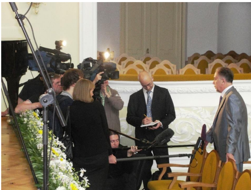
Фото 24. Ректор дает интервью журналистам перед торжественным открытием Большого зала Консерватории. 8 июня 2011 г.

Однако чудо произошло — успели: открытие БЗК состоялось в срок.