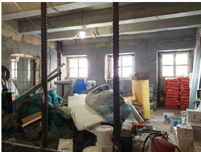
Фото 39. Строй-объект «1-5»: будущий 105 класс третьего корпуса. 13 мая 2021 г.