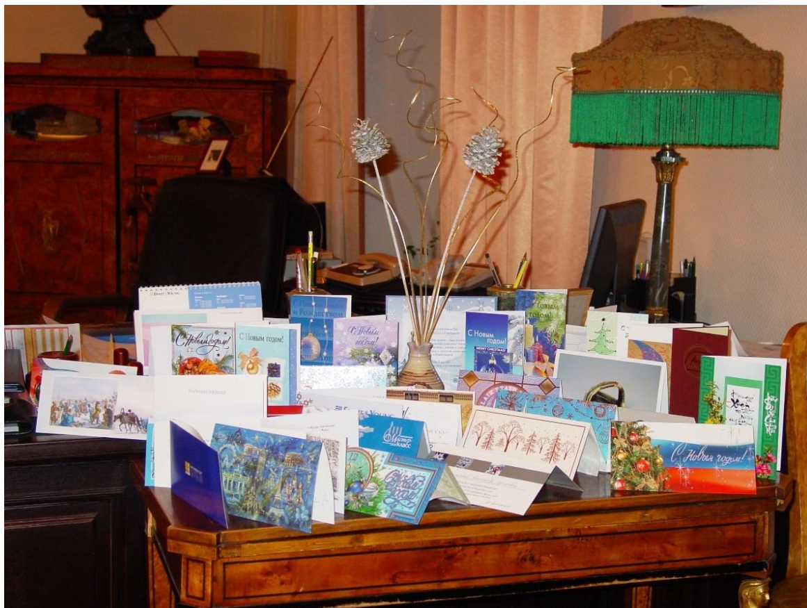
Фото 13. Поздравительные открытки на столе в ректорате. 26 декабря 2003 г.

Несмотря на все трудности, межвузовские, межотраслевые и международные связи консерватории продолжали шириться. В 2002 году в консерватории был создан (первый среди музыкальных вузов) Попечительский совет, в который вошли крупнейшие представители госструктур, бизнеса, науки. Вот так выглядел предновогодний стол ректора в 2003 году: