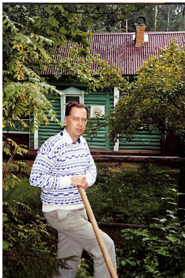
Фото 5. За садовыми работами у своего дома в Карачарово. 18 августа 2000 г.