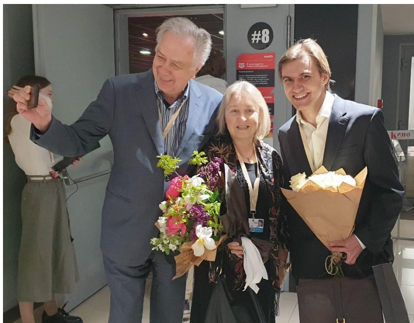
Фото 44. «Усталые, но довольные». После показа фильма в «Октябре». 21 апреля 2023 г.

Фильм был очень тепло принят зрителями 35 — мы же были рады признанию кинопрофессионалами нашего «побочного» (по отношению к основным видам консерваторской деятельности) творческого продукта. 36