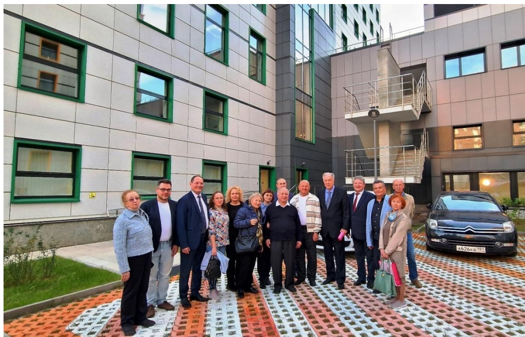
Фото 41. После экскурсии с членами Ученого совета во внутреннем дворе нового студенческого общежития. 26 сентября 2023 г.