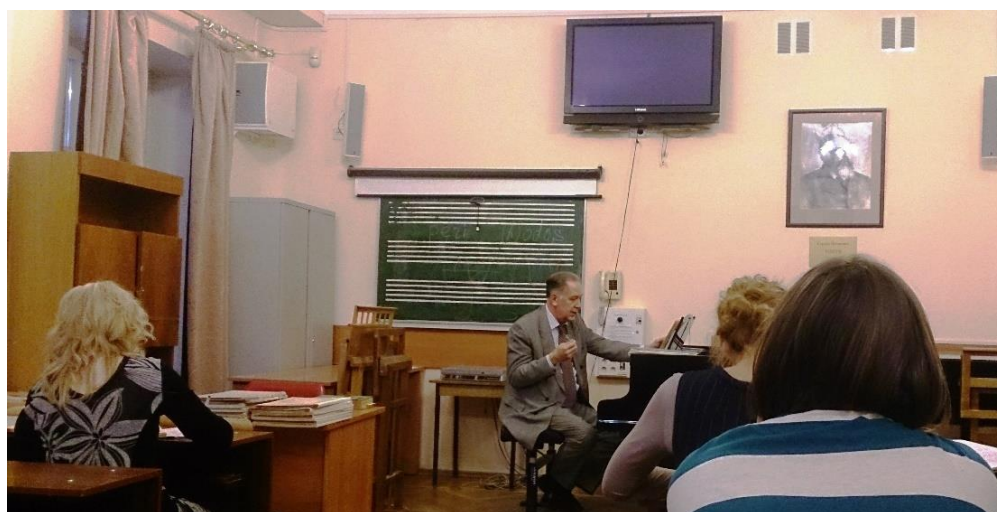
Фото 30. На лекции по анализу у студентов-теоретиков. 26 февраля 2014 г.

Академическая жизнь тем временем продолжала идти своим чередом — Александр Сергеевич читал лекции студентам в нашем «домашнем», восстановленном к тому времени 9-м классе. Теперь его музыковедческие объяснения уже не прерывались срочными звонками из госструктур, как это было шутливо обыграно студентами на капустнике.