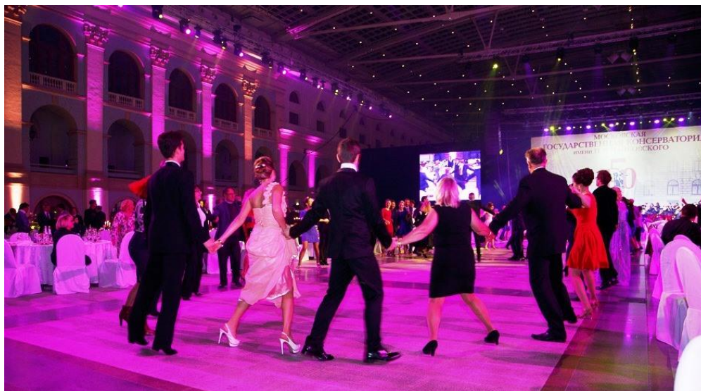
Фото 33. Ректор отплясывает с нами в круговом танце. Гостиный двор. 14 сентября 2016 г.

В сентябре 2016 года состоялись грандиозные торжества по случаю 150-летия Московской консерватории. Шли юбилейные концерты, на торжественных заседаниях членам Ученого совета и факультетов, педагогам и сотрудникам дарили памятные подарки. Квинтэссенцией празднеств стал блистательный гала-ужин в Гостином дворе — с музыкой, розыгрышем призов и танцами.