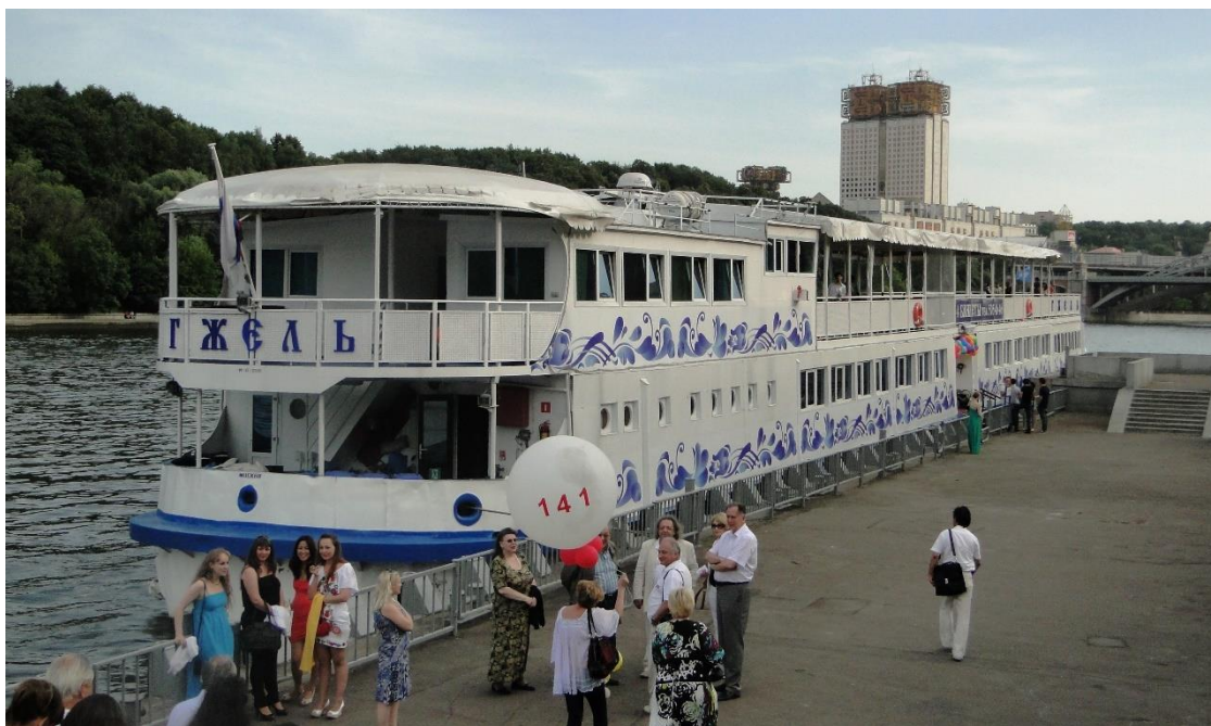
Фото 21. Перед круизом по Москве-реке на теплоходе «Гжель». 24 июня 2010 г.

Выпускные торжества в тот год расширили свою географию и продолжились на арендованном Консерваторией теплоходе.