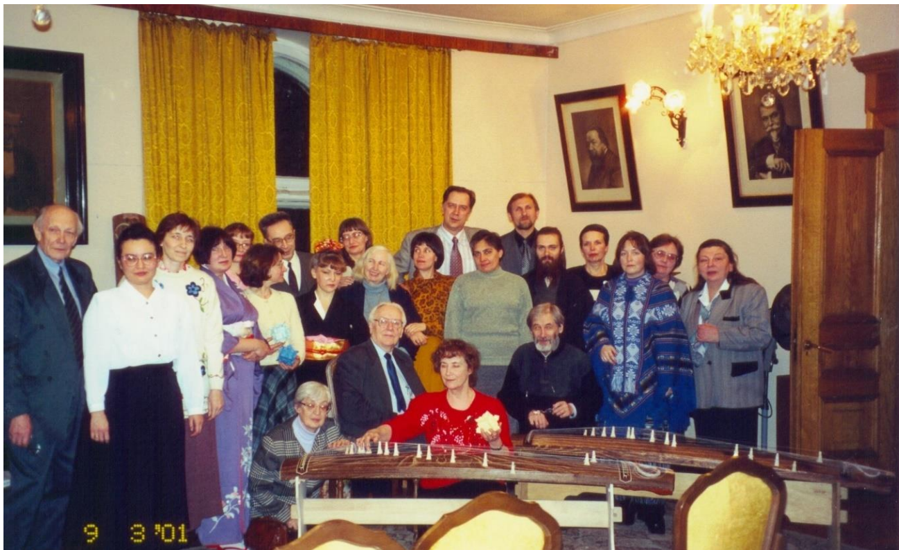
Фото 7. Кафедральное празднование в ректорате. 9 марта 2001 г.