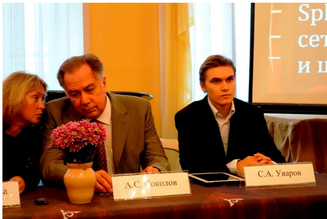
Фото 29. Последние согласования перед началом презентации. 19 сентября 2013 г.