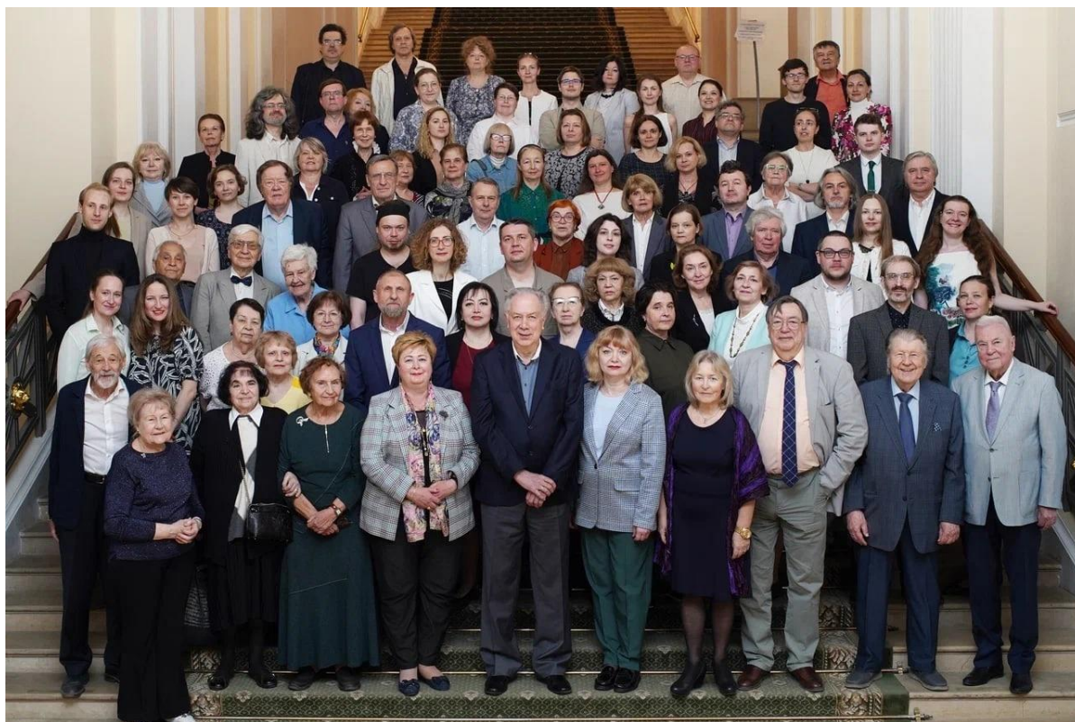
Фото 45. Научно-композиторский факультет Московской консерватории в лицах. На знаменитой «зеленой дорожке»: лестнице Большого зала. 17 мая 2023 г.