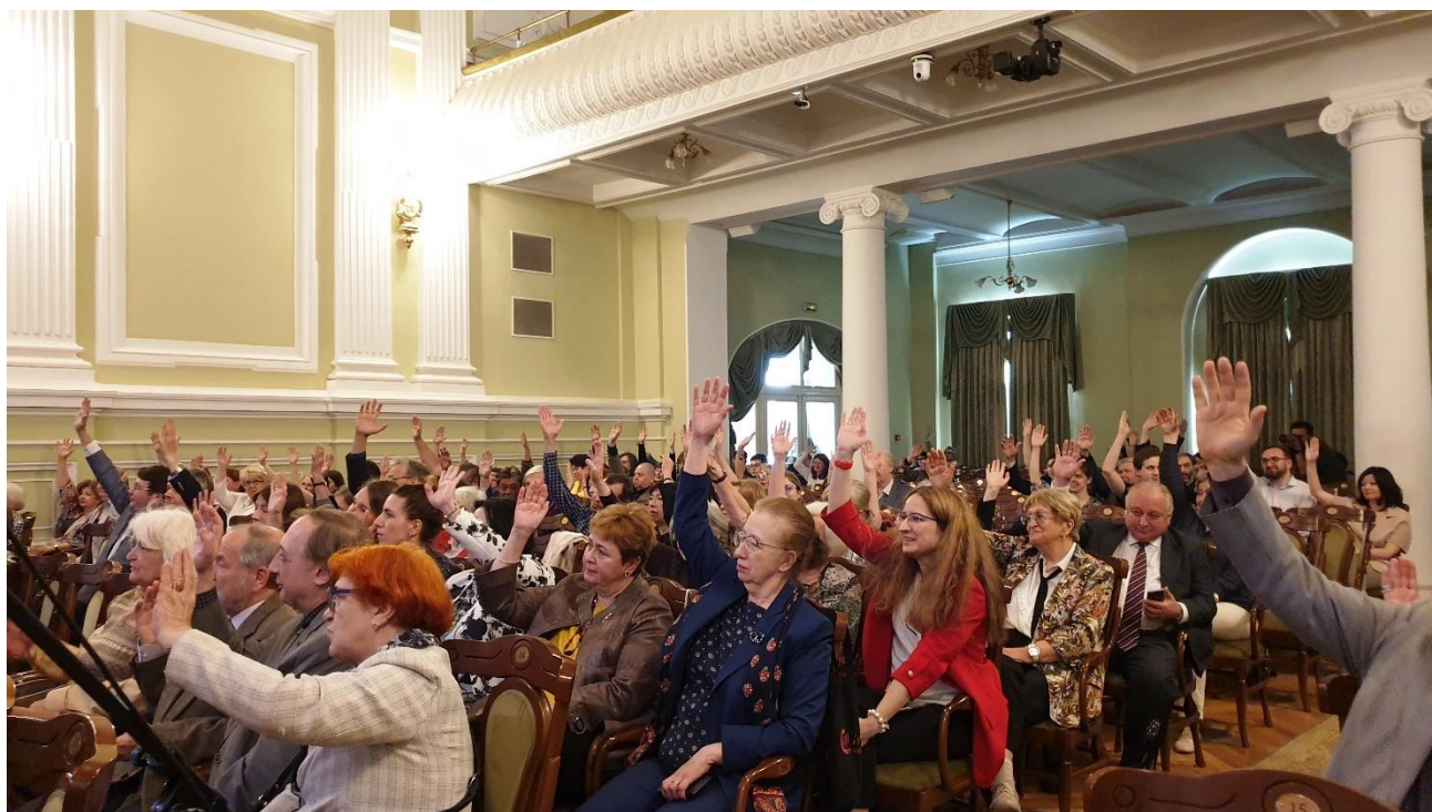
Фото 36. Ибо «коней на переправе не меняют». 24 мая 2019 г.