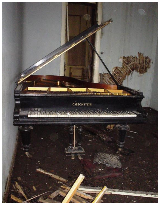
Фото 10. Так выглядел 3-й класс Малого зала после пожара. 19 декабря 2002 г.

В конце 2002 года Консерваторию и ее ректора ждало большое испытание: в корпусе Малого зала случился пожар, обгорел ряд классов (в том числе, с роялями). Я поехала туда 15 на следующий день после пожара, уговорив охрану пропустить меня в оцепленный учебный корпус для фотосъемки.