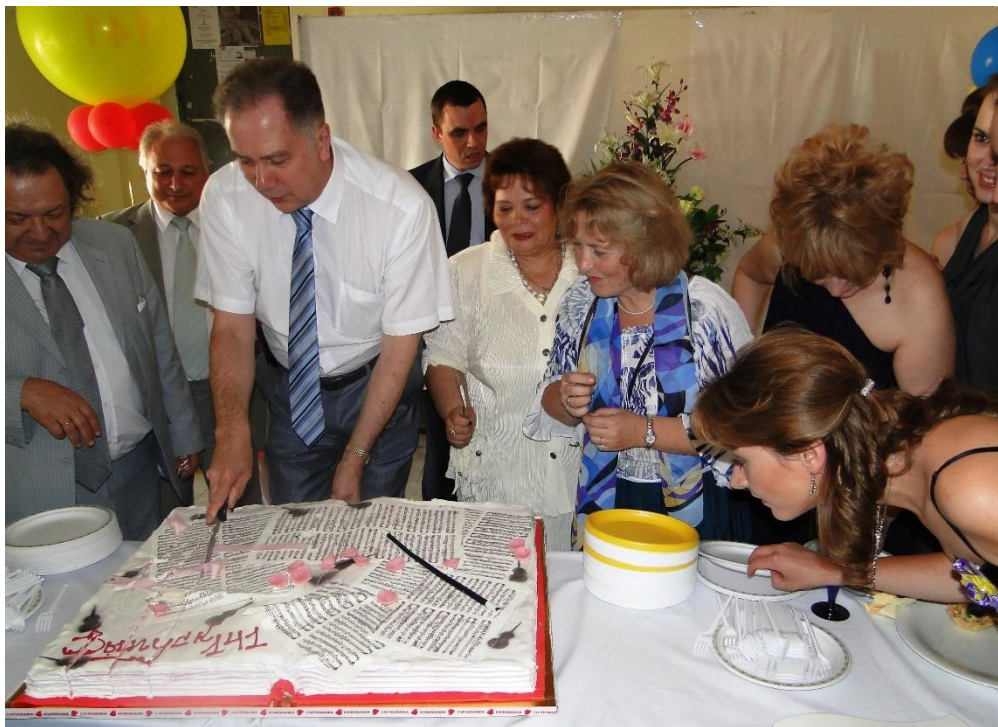
Фото 20. В фойе Малого зала ректор разрезает «сладкие нотные листы» — интересно, чья же музыка там напечатана? На праздничном фуршете после торжественного вручения дипломов. 141-й выпуск Московской консерватории. 23 Июня 2010 г.

Продолжились традиционные выпускные вечера, теперь с неизменным коллективным вкушением огромного и очень вкусного «музыкального» торта 16 .