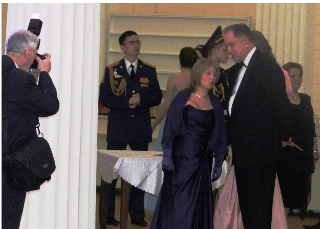
Фото 28. Перед началом бала: через несколько минут мне предстоит продемонстрировать то, чему меня удалось научить за последние недели. Самым легким все же было купить бальное платье и перчатки... 19 марта 2013 г.