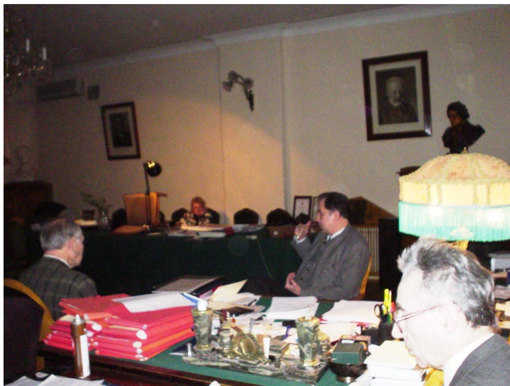
Фото 12. На заседании кафедры. 10 января 2003 г.

Заседания же кафедры пришлось проводить почти что «при свечах» (верхний свет не работал) в холодноватом зале ректората.